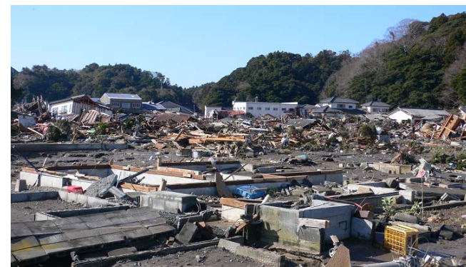
【豊間・薄磯地区の被災状況】

さらに、その後の原発事故の影響により、立入が困難な地域も多く、被災状況の確認も未だ困難なほか、今後の影響の拡大が懸念される状況となっております。