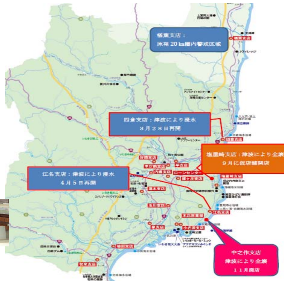
【津波被害により倒壊した中之作支店】